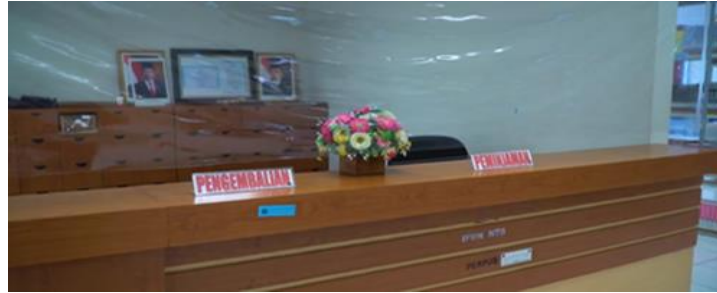
Gambar 4. Layanan sirkulasi perpustakaan IPDN Kampus NTB