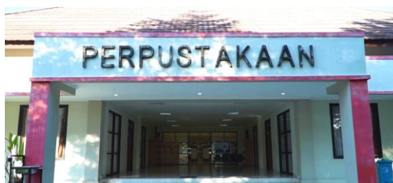
Gambar 2. Tampak depan gedung perpustakaan IPDN Kampus NTB

Unit Perpustakaan IPDN Kampus Nusa Tenggara Barat (NTB) yang terletak di Kabupaten Lombok Tengah Prov. NTB ini merupakan salah satu pelaksana dan pendukung visi misi IPDN Kampus NTB yang memiliki fasilitas memadai yang menyediakan berbagai macam kemudahan untuk menambah pengetahuan, baik bagi praja, dosen, masyarakat luas, maupun mahasiswa lain yang ada disekitar kampus. Perpustakaan yang memiliki luas gedung 907 m^2 ini memiliki visi menjadi pusat pengelola dan penyebaran informasi yang