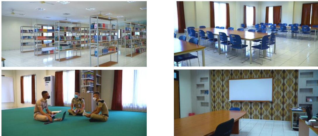
Gambar 3. Fasilitas perpustakaan IPDN Kampus NTB (kiri atas rak koleksi; kanan atas meja kursi ruang baca, kiri bawah ruang baca lesehan, kanan bawah ruang meeting)

Unit Perpustakaan IPDN Kampus NTB ini memiliki jumlah koleksi sebanyak 1.628 judul dengan jumlah eksemplar sebanyak 16.189 monograf. Fasilitas lainnya yang tersedia di perpustakaan IPDN Kampus NTB adalah rak-rak buku, koleksi, ruang baca (terdiri dari dua bagian yakni ruang baca yang menggunakan meja dan kursi serta ruang baca dengan model lesehan), dan ruang pertemuan ( meeting room ). Ruang baca dengan model lesehan sering digunakan untuk kegiatan pembinaan pemustaka dan digunakan sebagai lokasi diskusi pemustaka, rapat-rapat kegiatan kelompok-kelompok praja, dan lain sebagainya.